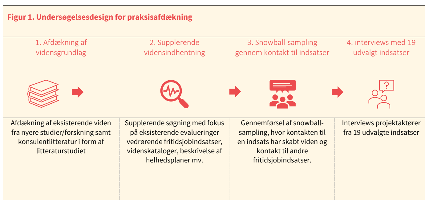
Figur 1. Undersøgellesdesign for praksisafdækning

Kontakten til projektaktører og kommuner gav et overblik ift. fritidsjobindsatserne, hvilket var nødvendigt, da der ikke foreligger skriftlig dokumentation for familieperspektiver og -resultater for de fleste indsatser. Meget få af de evaluerede indsatser havde således et (bevidst) familieperspektiv, ligesom flere af de evaluerede indsatser var ophørt – bl.a. fordi indsatsen var projektfunderet og ikke efterfølgende blev forankret. Med den personlige kontakt til nye som tidligere indsatser blev det muligt at lave en fokuseret screening, som gjorde det muligt at bygge videre på allerede indsamlet viden og dermed styrke kvaliteten og relevansen af det indsamlede vidensgrundlag.